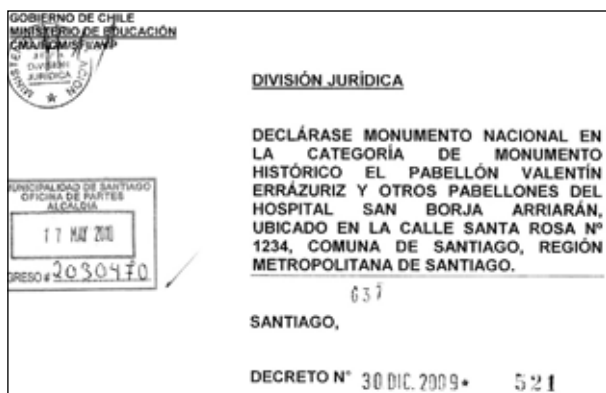
Extracto de Declaración oficial como Monumento Nacional